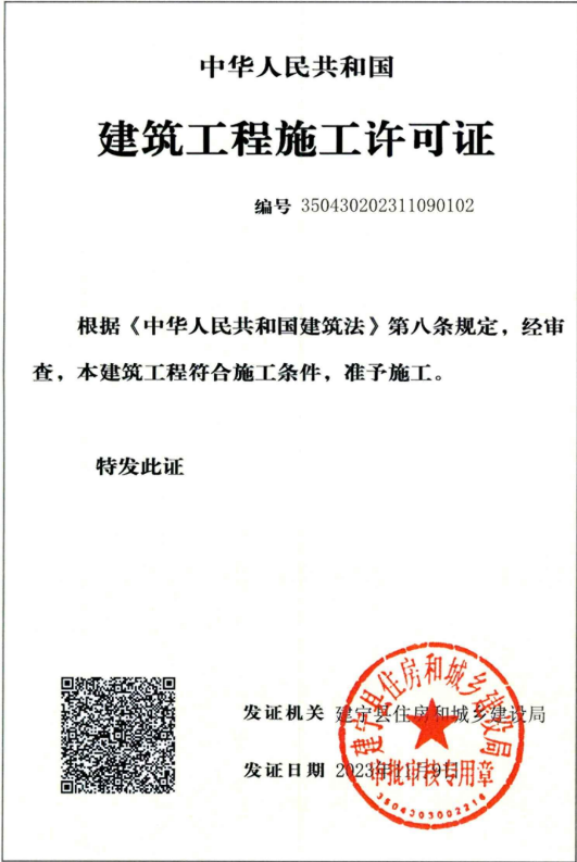
附件 6 建筑工程施工许可证（编号 350430202311090102）